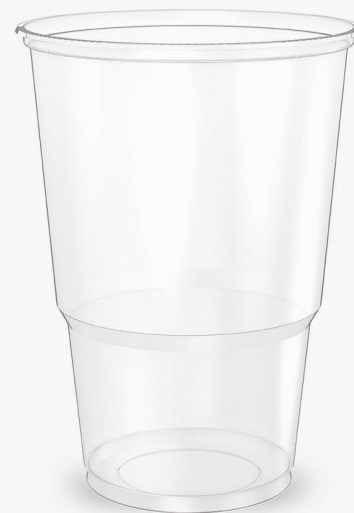
COPO GT TRANSPARENTE 300ml