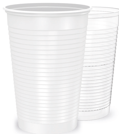
COPO HAPPY 300ml Branco | Transparente