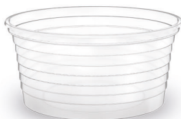
POTE 150ml Transparente