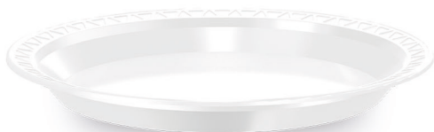
PRATO RASO Ø 21cm Branco