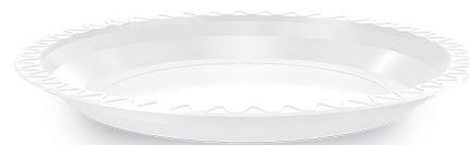
PRATO RASO Ø 18cm Branco