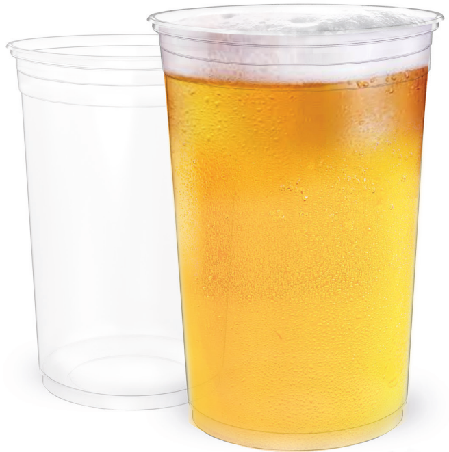
COPO LISO TRANSPARENTE 700ml