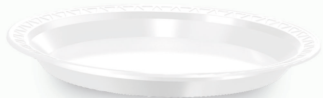
PRATO TRANSPARENTE BIODEGRADÁVEL Ø PR-21