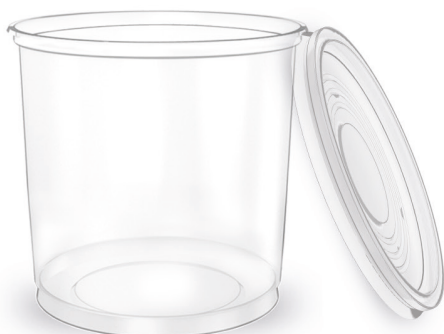
KIT POTE LISO TRANSPARENTE 250ml