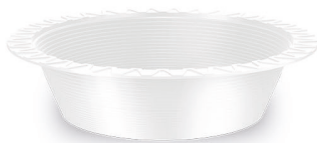
PRATO FUNDO Ø 15cm Branco