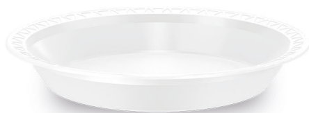
PRATO FUNDO Ø 21cm Branco