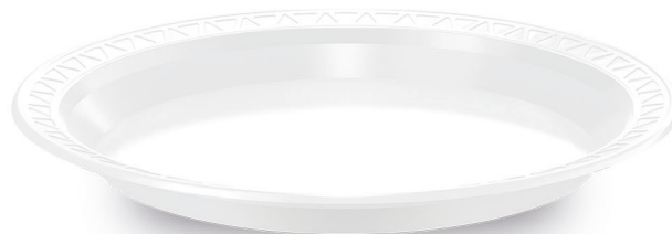
PRATO RASO Ø 26cm Branco