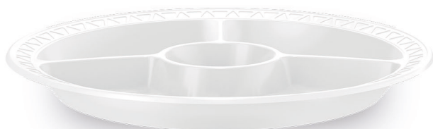
PRATO COM DIVISÓRIA Ø 26cm Branco