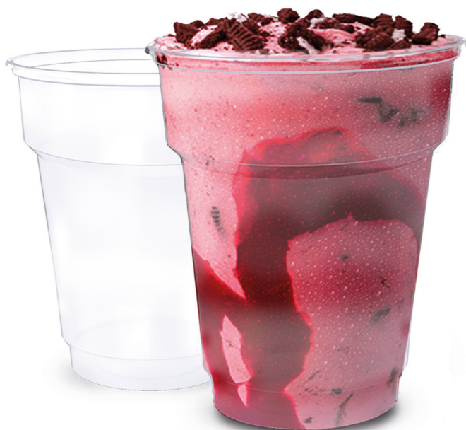
POTE SUNDAE LISO TRANSPARENTE 180ml