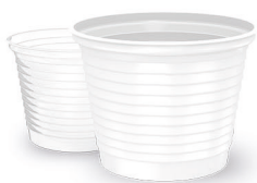
COPO 50ml Branco | Transparente