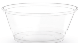
POTE LISO TRANSPARENTE 50ml