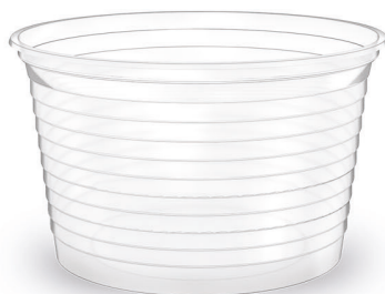
POTE 300ml Transparente