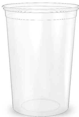
COPO TRANSPARENTE LISO 330ml