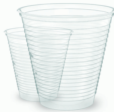
COPO TRANSPARENTE BIODEGRADÁVEL 200ml