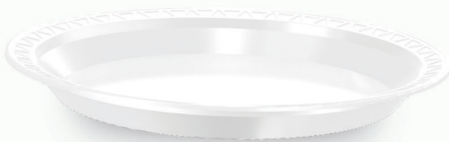
PRATO TRANSPARENTE BIODEGRADÁVEL Ø PR- 15