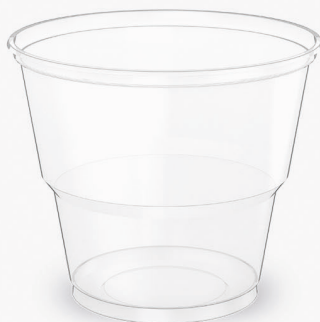
COPO GT TRANSPARENTE 150ml