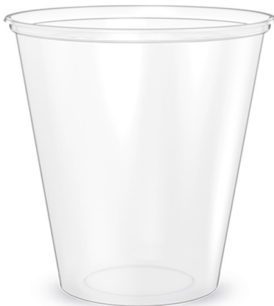
COPO LISO TRANSPARENTE 500ml