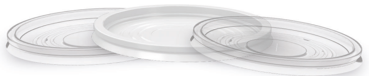
TAMPA COM E SEM FURO TP-1500 Branco | Transparente | Transparente com furo