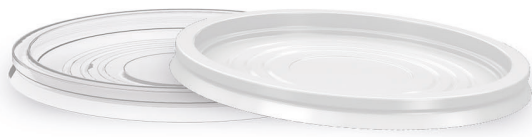
TAMPA SEM FURO TP-1000 Branco | Transparente