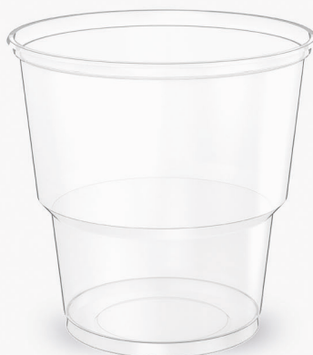
COPO GT TRANSPARENTE 200ml