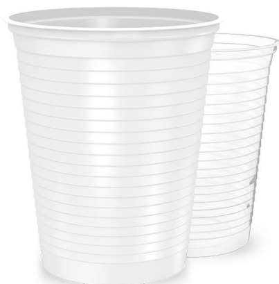
COPO HAPPY 200ml Branco | Transparente