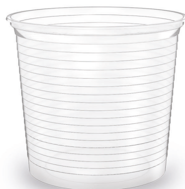
POTE 500ml Transparente