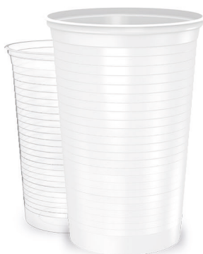
COPO 250ml Branco | Transparente