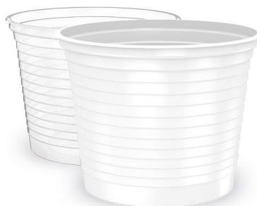
POTE 250ml Branco | Transparente