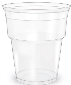
COPO TRANSPARENTE LISO 250ml