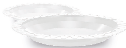
PRATO RASO Ø 15cm Branco | Transparente