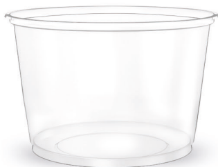
POTE LISO 200ml Transparente