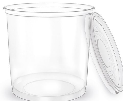
KIT POTE LISO TRANSPARENTE 500ml