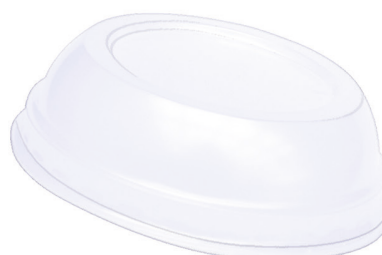
TAMPA BOLHA TRANSPARENTE