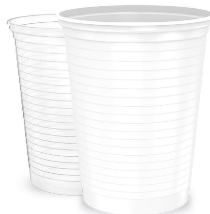
COPO 400ml Branco | Transparente