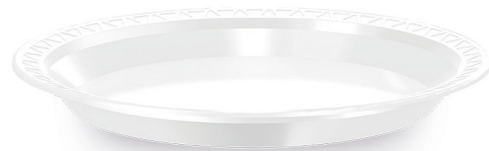
PRATO RASO Ø 23cm Branco