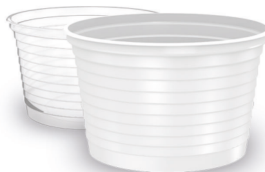
POTE 200ml Branco | Transparente