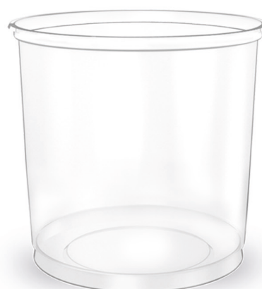
POTE LISO TRANSPARENTE 500ml