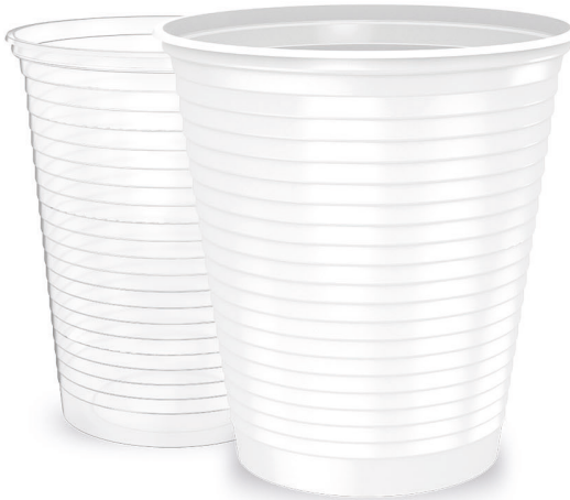
COPO 500ml Branco | Transparente