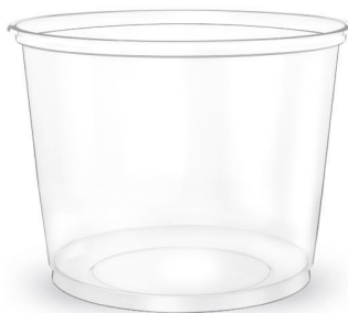
POTE LISO 250ml Transparente