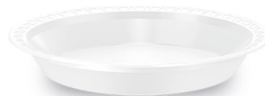
PRATO FUNDO Ø 18cm Branco