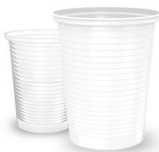
COPO 80ml Branco | Transparente