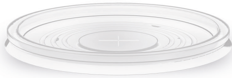
TAMPA TRANSPARENTE COM FURO TP-1000