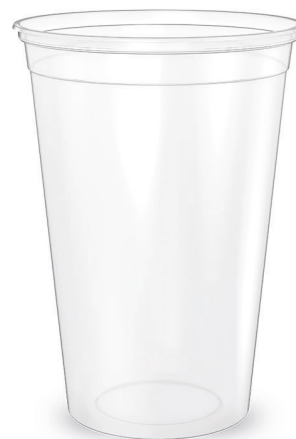
COPO TRANSPARENTE LISO 400ml