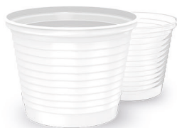
COPO HAPPY 50ml Branco | Transparente