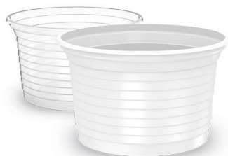
POTE 100ml Branco | Transparente